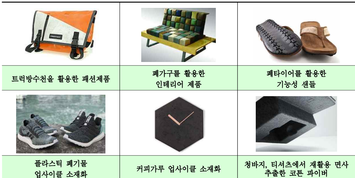
< 업사이클 제품 및 소재 예시 >